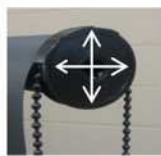
Position end cap correctly