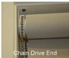
Chain Drive End

For large width blinds, have a second person help hold the blind into position. This eliminates the risk of dropping & damaging the blind.